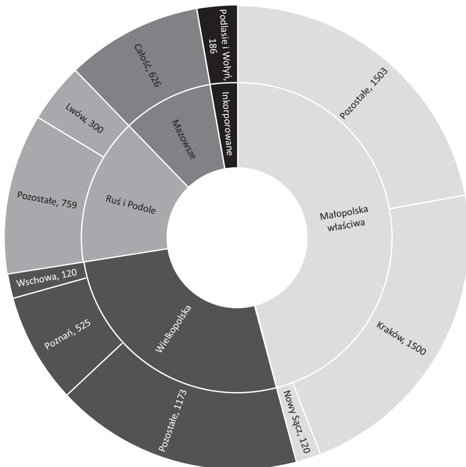
Wykres 1. Struktura wpływów podatkowych w latach panowania Stefana Batorego bez uwzględnienia libertacji uzyskanych przez miasta